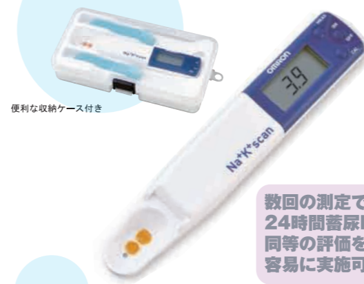
便利な収納ケース付き

尿中のNa/K比(ナトカリ比)を簡単測定 高血圧を予防する減塩・カリウム摂取の客観評価と動機付けのための簡単ツール