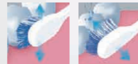
タテ振動 ヨコ振動