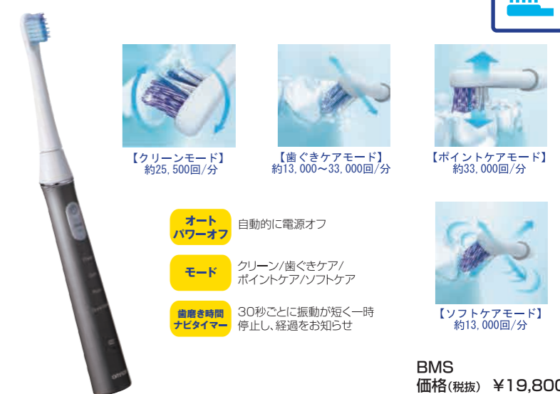
【クリーンモード】約25,500回/分 【歯ぐきケアモード】約13,000~33,000回/分 【ポイントケアモード】約33,000回/分 【ソフトケアモード】約13,000回/分

歯周ポケットケアに最適な45度の角度を光でお知らせ 選べる4つのブラッシングモードのフルスペックモデル